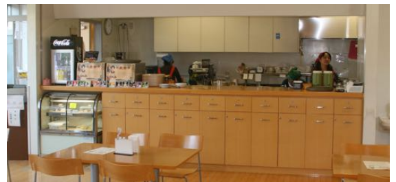
明るいぷらっとの店内

もコンスタントに出ます。多くの方に美味しいといただいています。図書館帰りに立ち寄ってくださる常連さんもらっしやいました。」