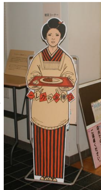
等身大キャラクター

ぷらっとでは、白樺派のカレーの等身大キャラクターがお客様を出迎えています。「等身大キャラクターはお子様にも人気です。また、白樺派文学を研究している学生さんが立ち寄られ、記念に写真を撮って帰られたこともありました。」