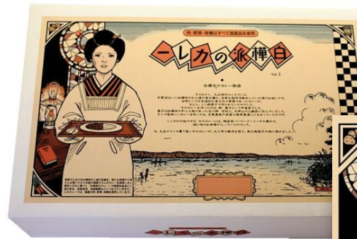
レトルトカレー 贈答用6個パック

その後、新しい関係者の方々のご協力を得て、レトルトカレーも発売されたり、数多くデザインしてきました。結果として、メンバーの後押しもあり、私らしいユニークなものできていると思っています。気がつく と、当たり前前のことですが、今度は、私が応援されている！ということになりました。」