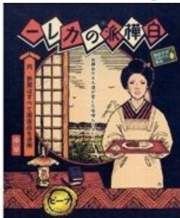
ビーフ (720円) (税込み価格)