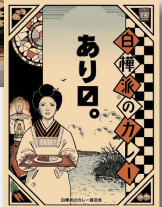
白樺派のカレーを提供する レストランが店頭に掲示する看板 「白樺派のカレーあり口」