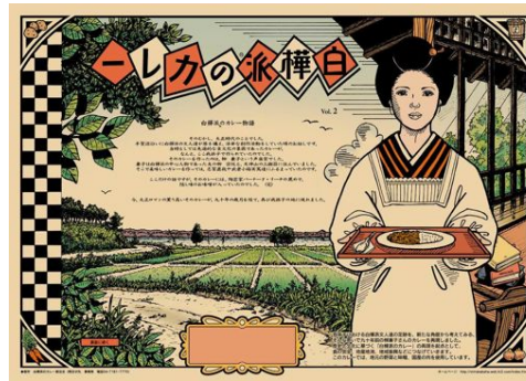
ランチョンマット 第二号