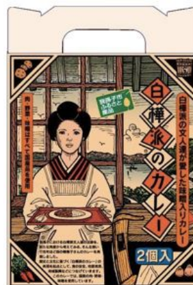
贈答用2個パックと3個パック